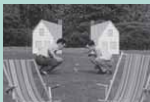
נורמן מקלרן, Neighbors