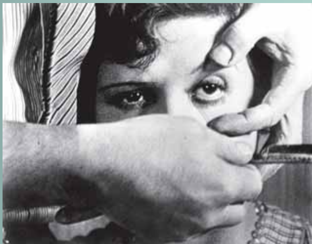
לואיס בונואל, Un chien andalou

דברי מבוא: סרג'יו אדלשטיין / קבוצת Sala-Manca