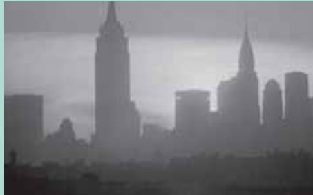
ד'א' פנבייקר, Daybreak Express